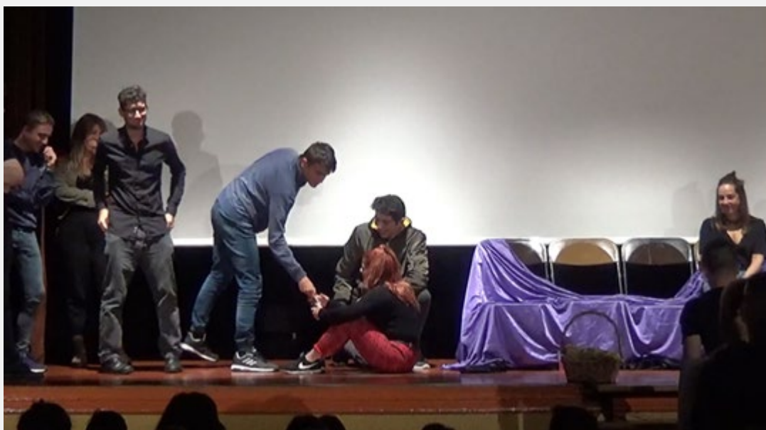
Figura 2. Estudiantes de educación secundaria actuando en la propuesta transformadora.

La idea de ser un/una “espectador/a participativa transformadora” no es fácil para los y las estudiantes de la ESO, ya que, como “audiencia” no van preparados para encontrarse con una obra en la que les harán participar y salir de su rol “contemplativo” para involucrarse en un rol activo y de cambio a través de su opinión. Participar en la “recreación” teatral posterior que les proponen los mediadores y mediadoras conlleva en los grupos de dinamización organizar y resolver quién será el “espectador-actor”, la “espectadora-actriz” que se manifestará desde el público o desde el espacio escénico, en la Figura 2. Es un momento de exposición que no todos y todas están dispuestas a asumir, por lo que aquí el rol de la mediación es fundamental para persuadirles y motivar su participación, no sólo con sus reflexiones en el diálogo, sino también corporizando la realidad transformadora.