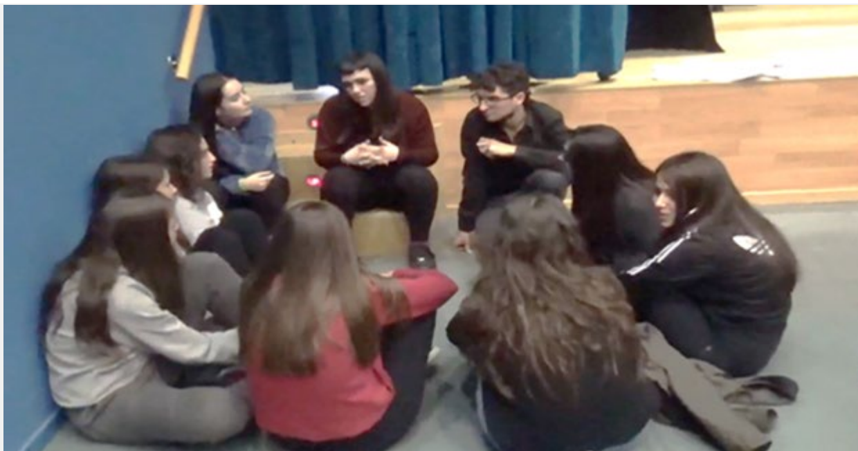
Figura 1. Agrupamiento de dinamización.

El proceso de dinamización que se realiza tras la presentación de la obra consta de tres etapas: a) Activación del diálogo y reflexión a través de pedagogías críticas dialógico-reflexivas para la implicación afectiva en las escenas representadas (Villanueva, 2019); b) Facilitación del aprendizaje para la comprensión de la obra (Motos, Navarro, Ferrandis y Stronks, 2013) y la problematización de los conocimientos tácitos de género como los micromachismos (Santos, 2020); y c) Creación de narrativas generadas por la audiencia y desarrollo de la competencia espectatorial del público con enfoque de género feminista (Helbo, 2021; Boal, 2002).